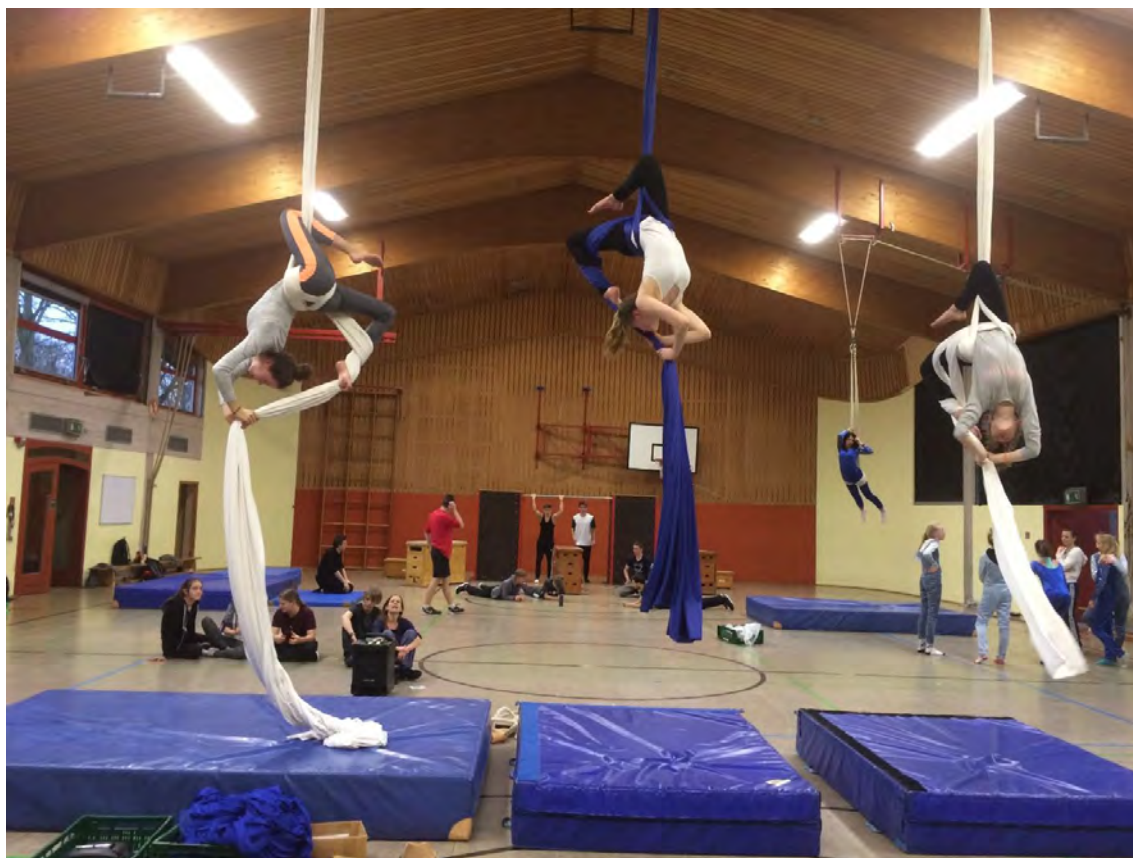
Ein „Vorgeschmack“ auf die Zirkusvorstellung

Am 24. um 17.00 Uhr, am 25. Um 16.00 Uhr und am 26.03.2017 um 12.00 Uhr öffnen wir die Manege des „Zirkus Widari“ für eine unvergessliche Zirkusreise. „Robbi, Tobbi und das Fliewatüt“ laden zum Lachen, Staunen und Träumen ein. Vorverkauf (Ticket 2 €) täglich von 9:45 bis 10:15 Uhr im Foyer der Widar Schule, Vorbestellungen hier per E-Mail (nur noch für Sonntag) möglich. Abholung der Karten am 24.03. um 12.15 Uhr.